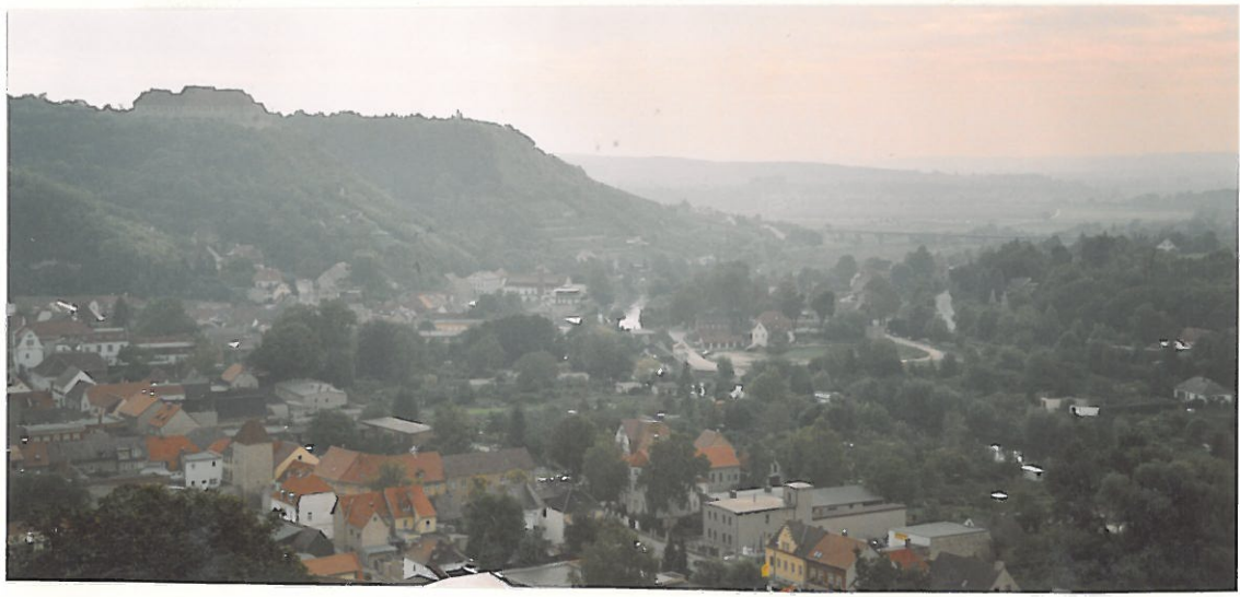
Blick von den Weinbergen auf Freyburg