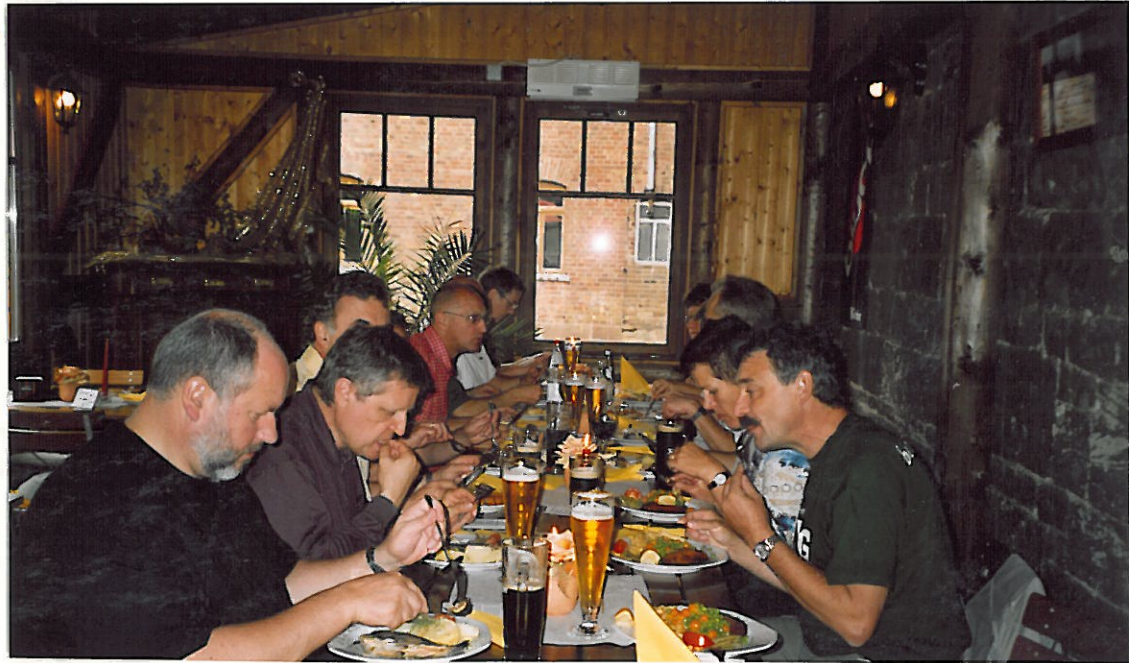
Speisen und Besichtigung in der Zettenbacher Mühle