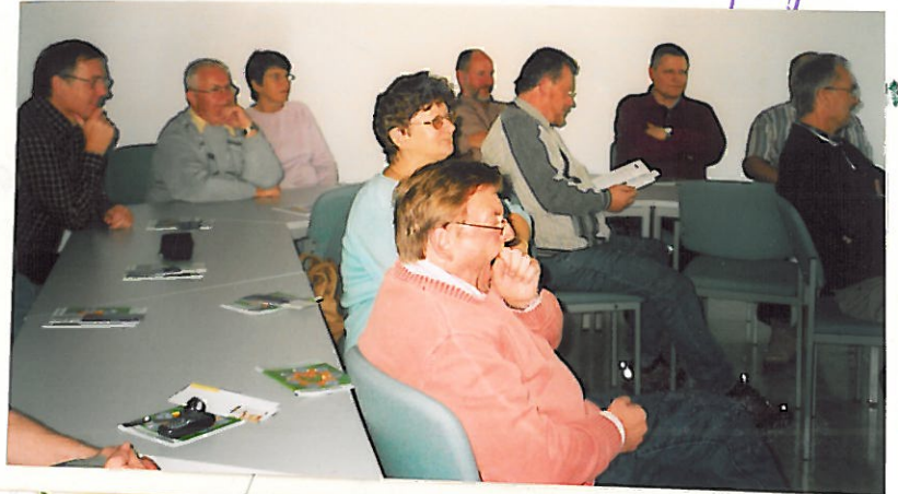
Im Kraftwerks- labor