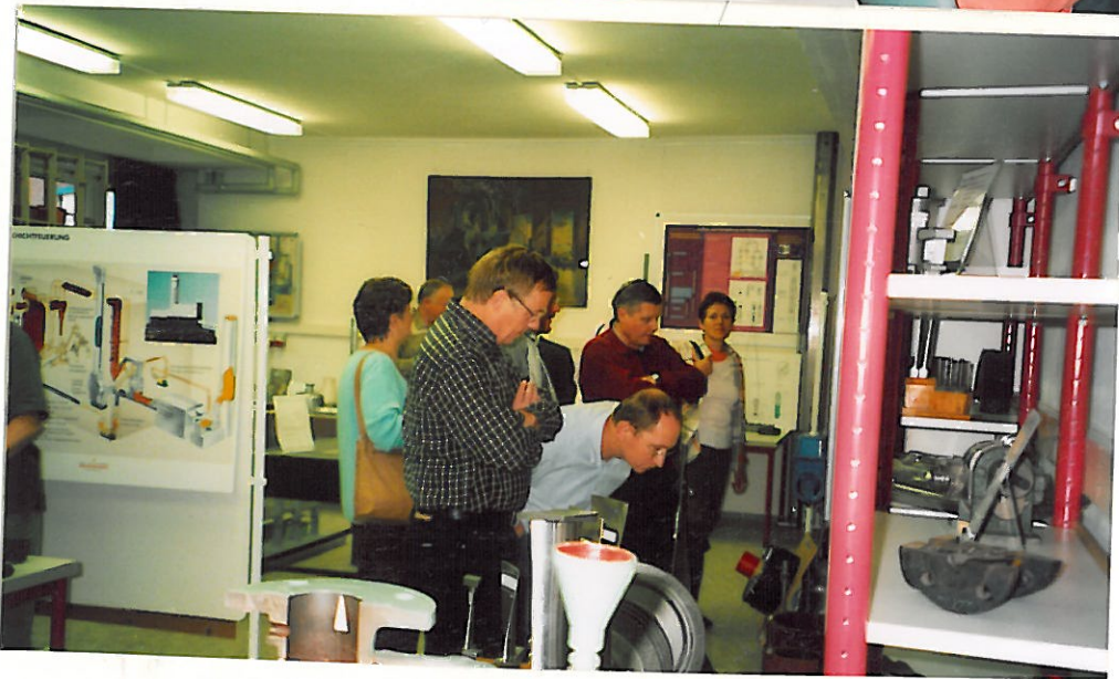
Fahrt nach Bertsdorf (solche Bilder waren früher s/w u. die Akteure 30 Jahre später)