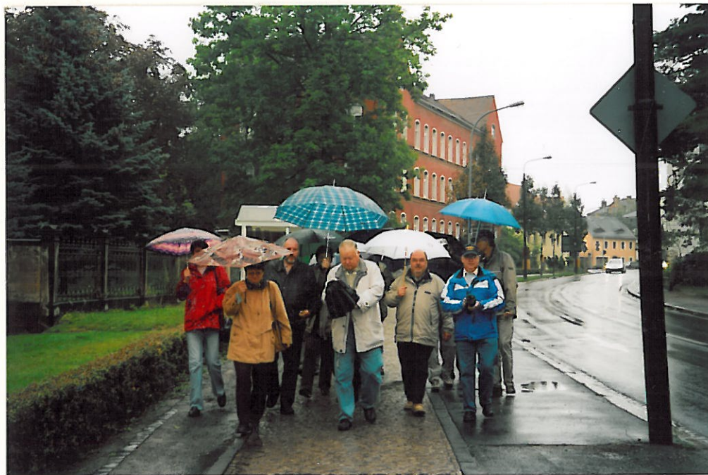
"Gruppenbild" des Treffens 2004 (nicht symbolisch für die Stimmung!!)