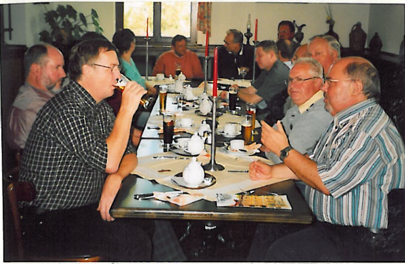
„Kaffee“-Tafel im Hotel

„Bahnhof Bertsdorf“, anschließend alles einsteigen zur Gebirgsrundfahrt