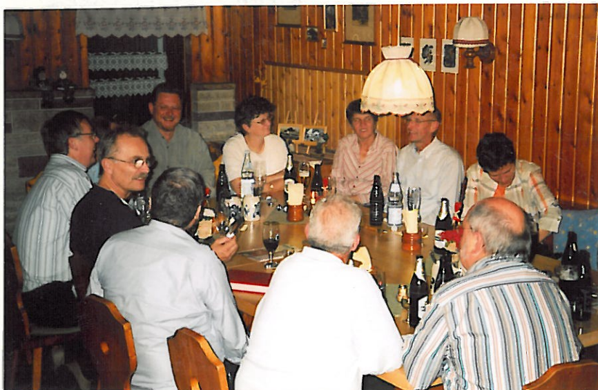
Routinierter, disziplinierter Beginn des Begrüßungsabends