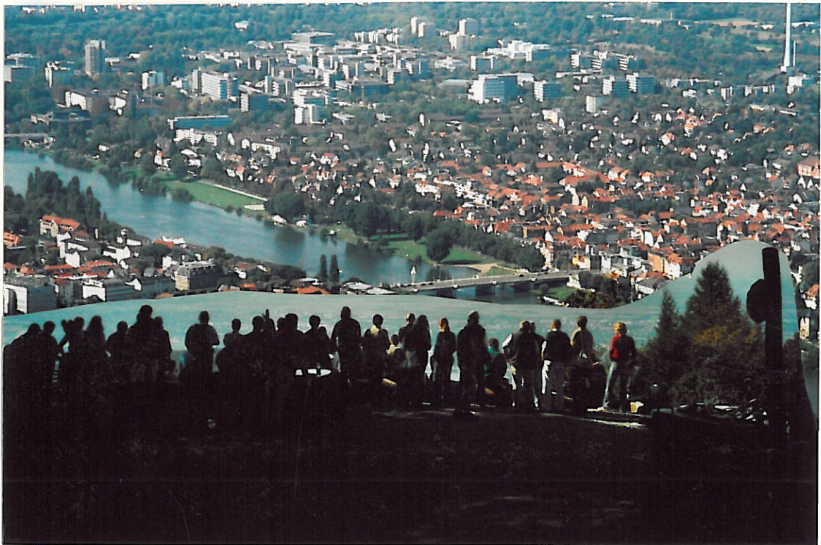
MKD-Silhouette über dem Neckartal