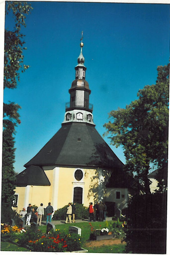
Kirche Seiffen Herrliches Wetter!