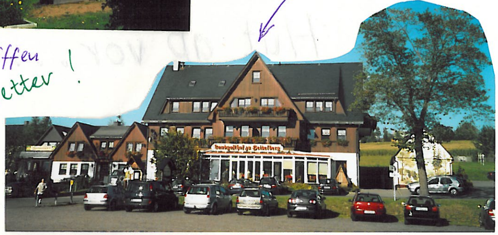
unser schönes Quartier

Während die MKD gelassen im Hintergrund der Dinge harvt, die da noch kommen, müssen die Senioren vorn ihr Programm straff abspulen