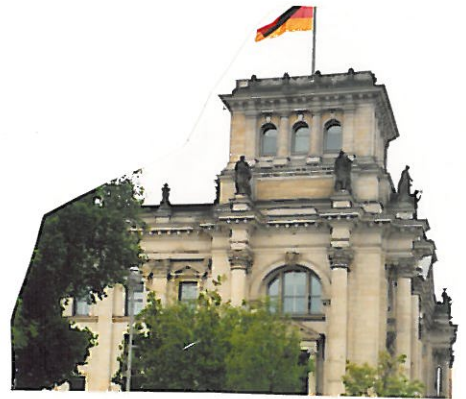
und Abschlußfeieressen in den