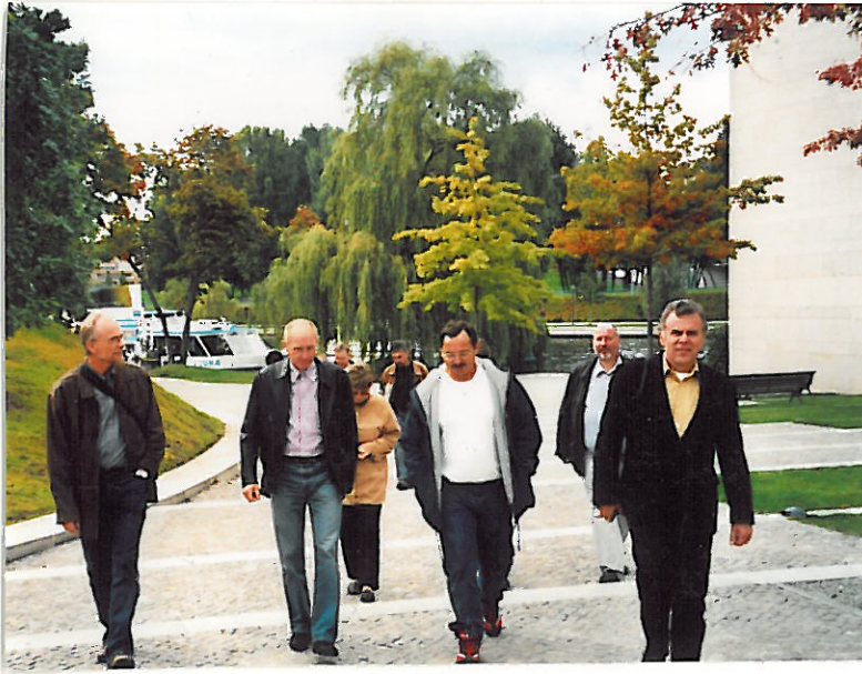
Rückweg vom „Dampfer“