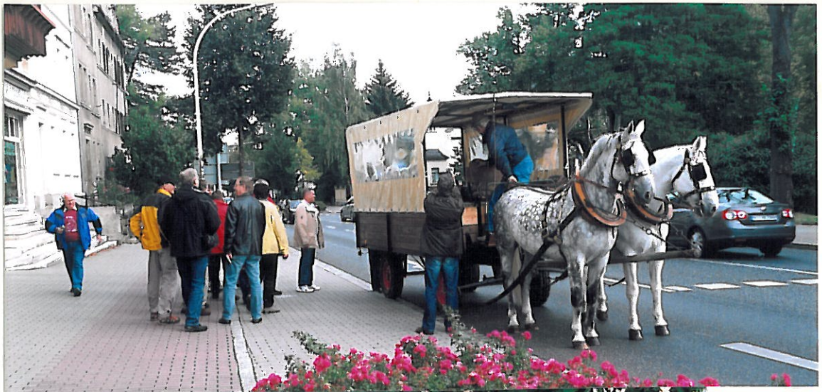
Stadtrundfahrt per Kramser