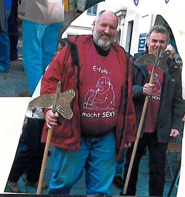
In Zittau war es schön und unterirdisch!