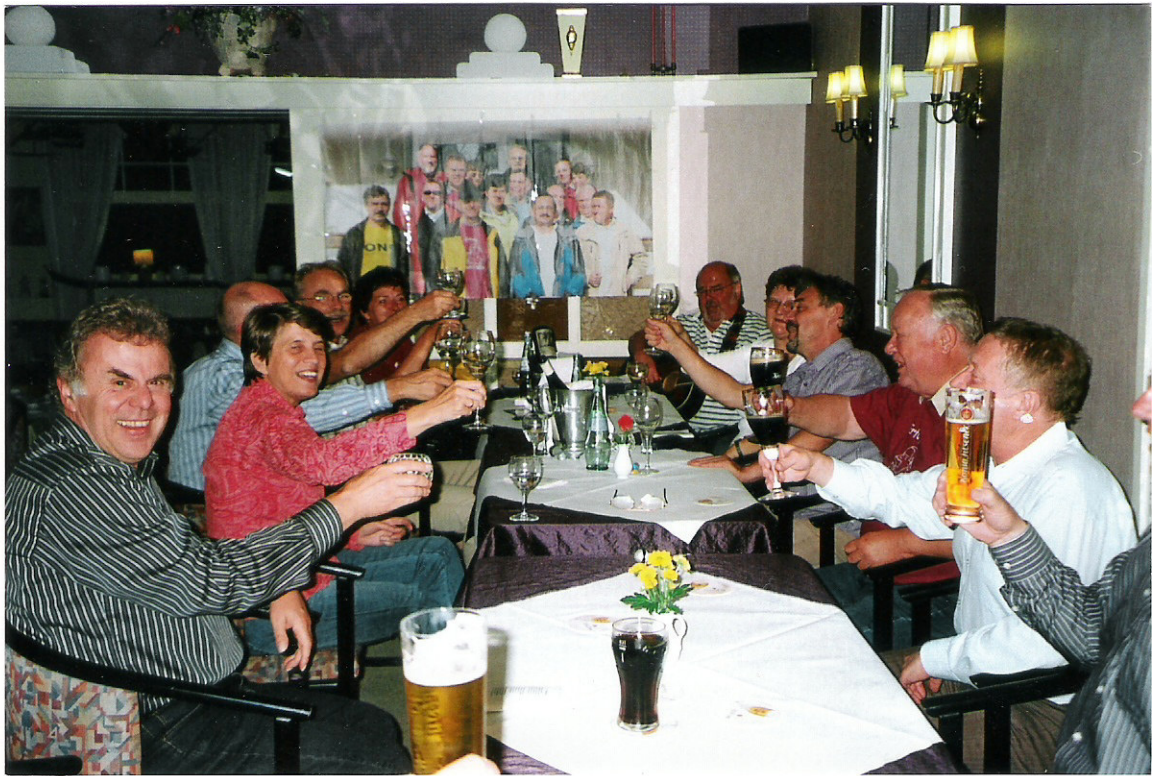
Ein Prosit, ein Prosit - -