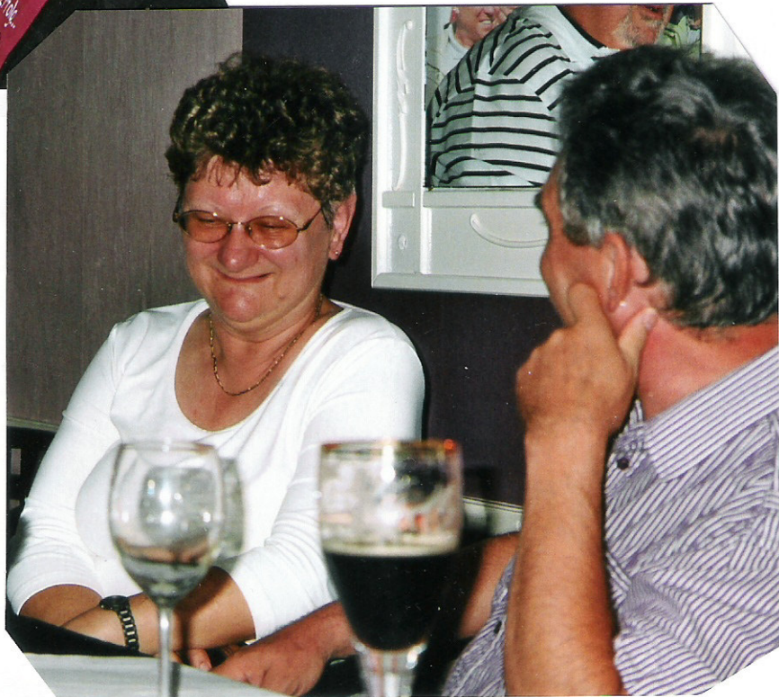
Dieses Bild gibt viele schöne Rätsel auf !!