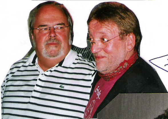
← Professore & Doctore