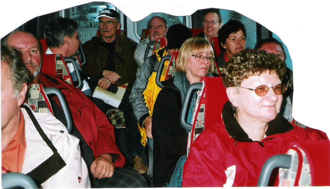
Noch mangelnde Fitness im Bus nach Bernkastel