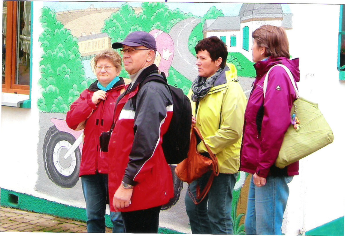
Ex-Thüringer mit Damenwandergruppe