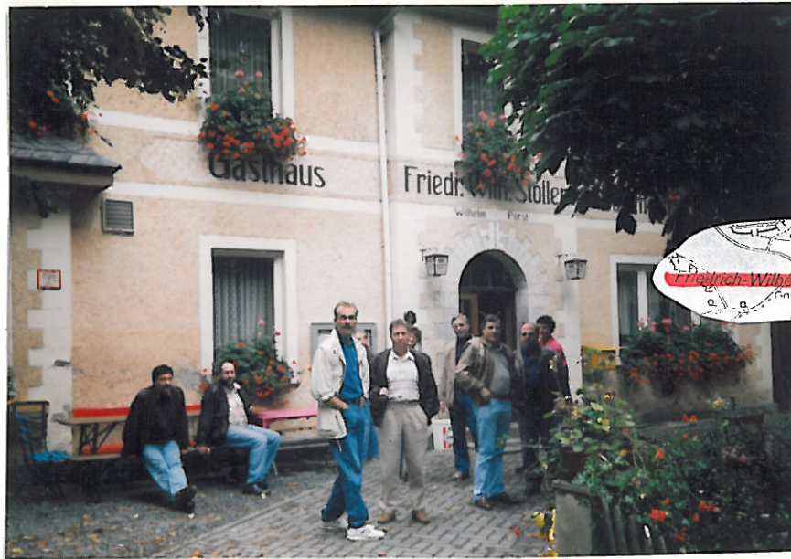
Abstecker zum F.-W.-Stollen