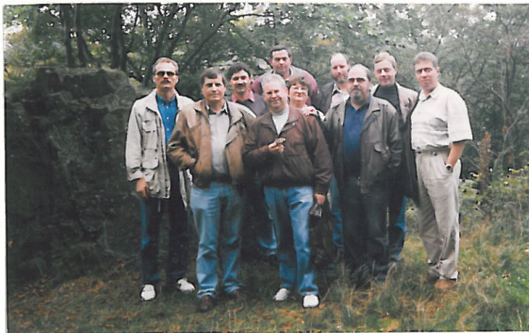
Gruppenbild mit Dame